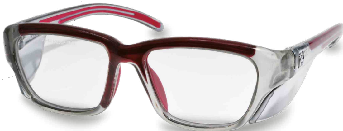
· Jerez Granate